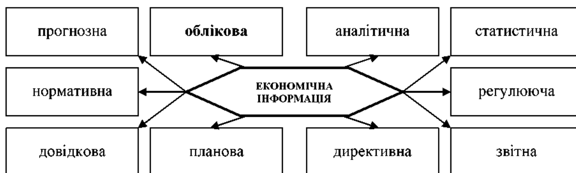
Рис. 1. Класифікація економічної інформації залежно від виконуваних в управлінні функцій

III. Результати. У масиві даних про підприємства, установи, організації, державні структури, суспільні зміни тощо формується економічна інформація, яка "використовується на всіх рівнях управління народним господарством країни" [3]. Виокремлюють різні ознаки її класифікації, найважливішою з яких є поділ відповідно до виконуваних в управлінні функцій (рис. 1).