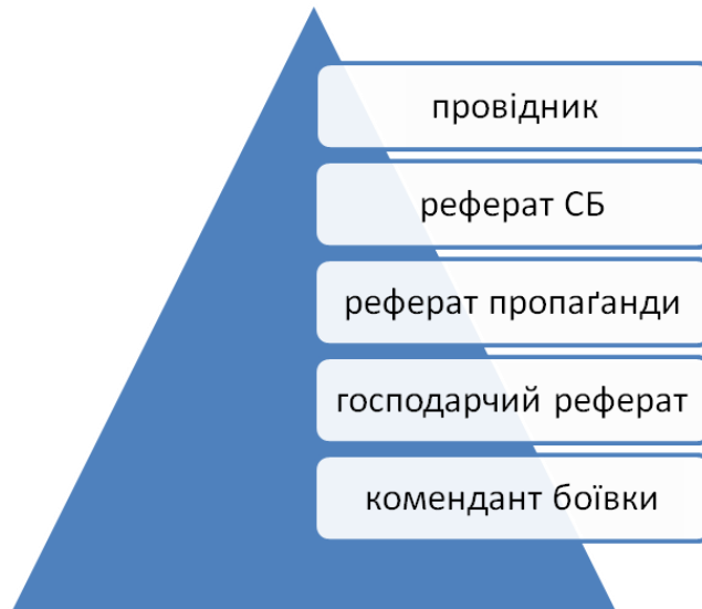
Організаційна структура проводу III району надрайону “Левада”