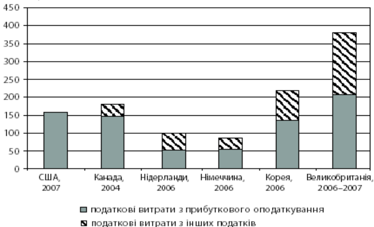
Рис. 2. Кількість статей податкових витрат в країнах ОЕСР

Як бачимо, кількість статей податкових витрат у Німеччині найменша, тоді як найбільша спостерігається у Великобританії (з прибуткового оподаткування – 208, з інших податків – 174).