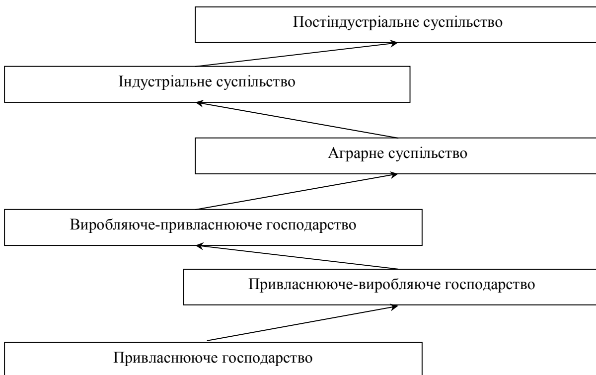
Рис. 1. Спіраль удосконалення образу життя

Крім цього, багато хто вважає, що нині у найрозвинутіших країнах йде становлення постіндустріального суспільства, котре називають по-різному: інформаційним, екологічним, творчим, технотронним, інноваційним соціумом.