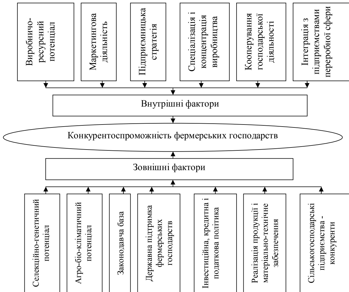
Рис. 2. Фактори конкурентоспроможності фермерських господарств

Конкурентоспроможність фермерських господарств залежить від великої кількості факторів, які умовно можна поділити на внутрішні (земля та її якість, трудові ресурси, засоби виробництва, матеріалозабезпеченість, ступінь кооперування господарської діяльності) та зовнішні – селекційно-генетичний і агро-біокліматичний потенціал регіону, законодавча база, державна підтримка фермерських господарств, кредитна система, умови реалізації продукції та матеріально-технічне забезпечення, діяльність інших господарств-конкурентів (рис. 2).