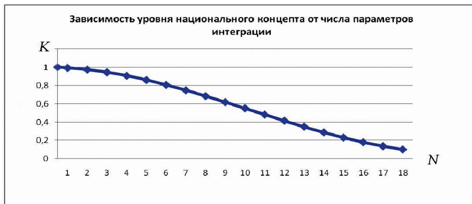
Рис. 2. Залежність рівня національного концепту від числа параметрів інтеграції

Графік функції K(N) представлений на рис. 2.