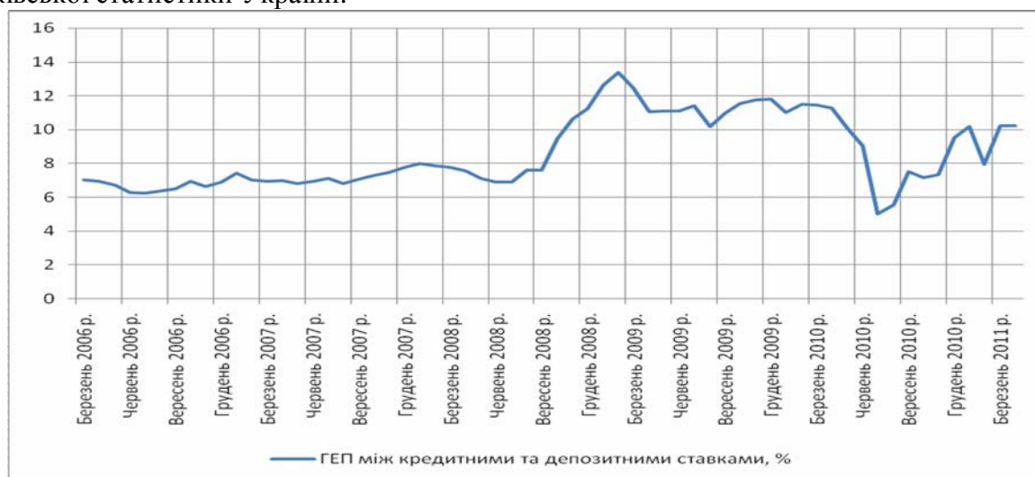
Рис. 2. Динаміка спреду між ставками по депозитам та по кредитам за період з березня 2006 по квітень 2011 року

активів підприємств з мінімальним рівнем прибутковості, та ставок за кредитами депозитних установ України. На рис. 2 наведено динаміку спреду між ставками по депозитах і по кредитах за період з березня 2006 по квітень 2011 року, що розрахована як різниця середнього геометричного інтегральних ставок за кредитами і депозитами за даними банківської статистики України.