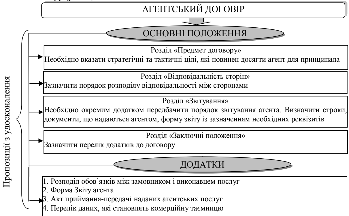
Рис. 3. Пропозиції щодо усунення недоліків у агентських договорах

Наведені вище недоліки пропонуємо усунути шляхом доповнення підрозділів агентського договору (рис. 3).