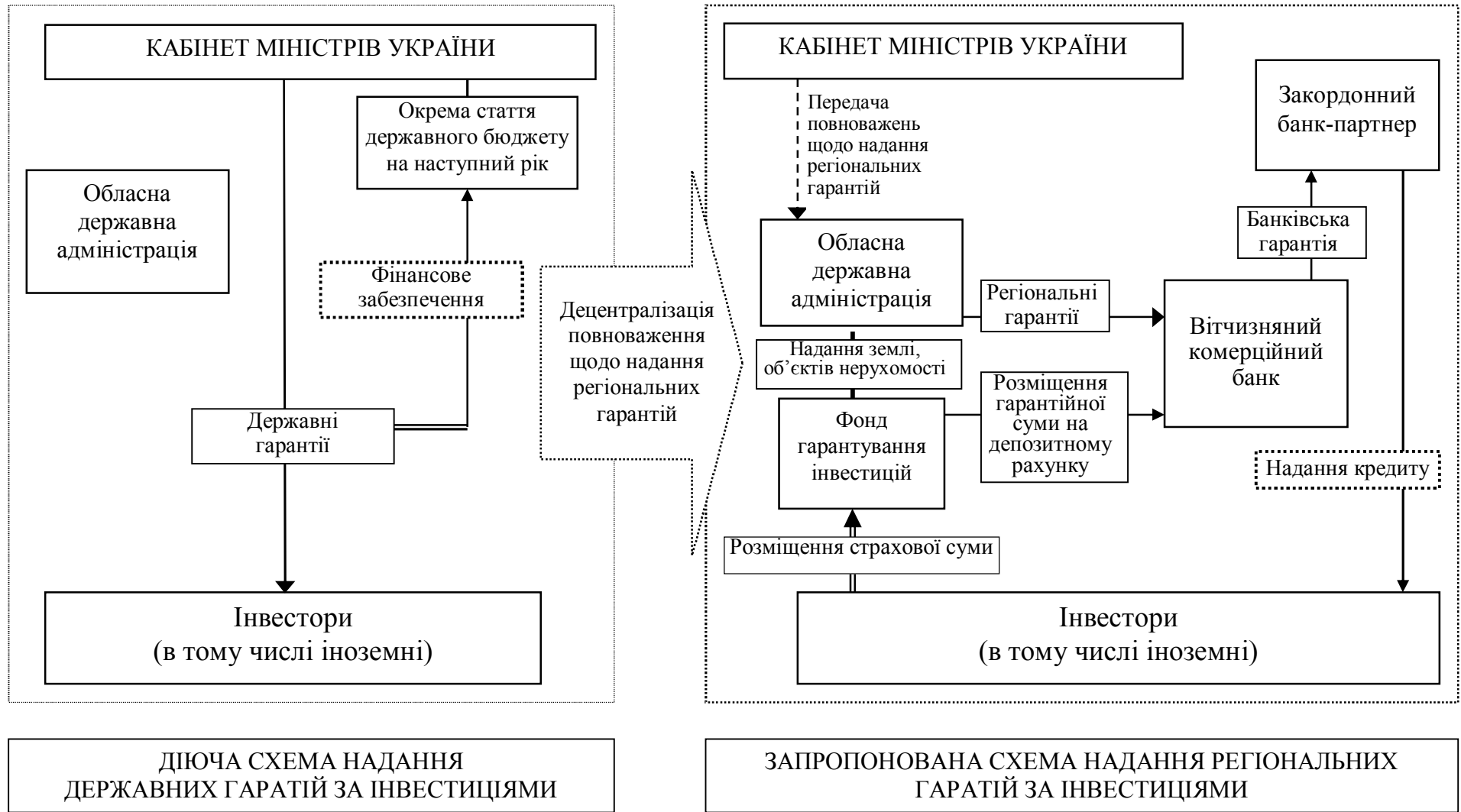
Рис. 2. Співставлення діючої та запропонованої моделей надання державних гарантій за інвестиціями