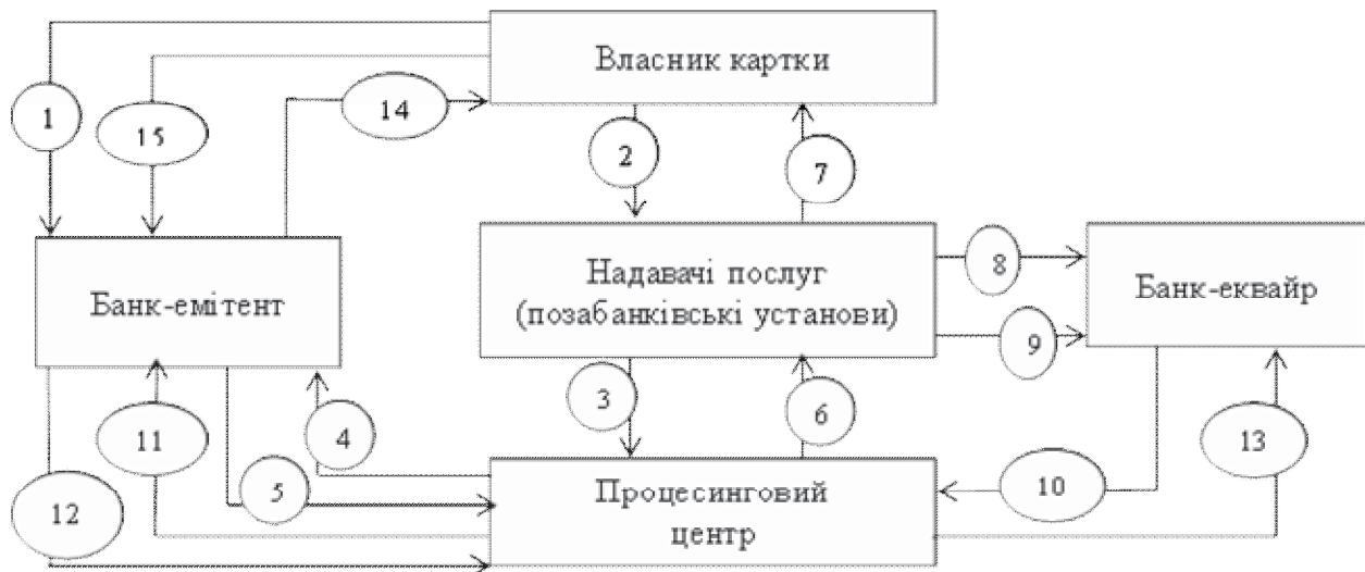
Рис. 1. Схема взаємодії учасників карткового проекту

Доцільно розглянути особливості взаємодії учасників карткового проекту: