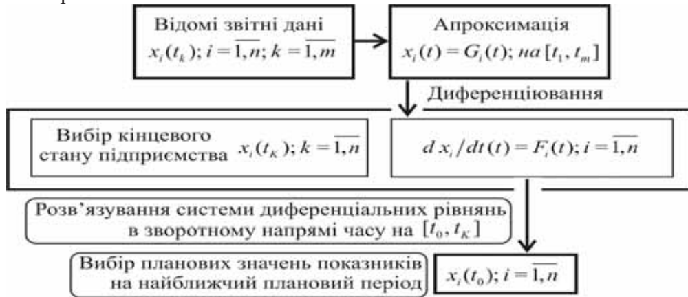
Рис. 1. Схема квазіоптимального планування показників діяльності підприємства

Схематично описаний метод квазіоптимального управління діяльністю підприємства відображено на рис. 1.