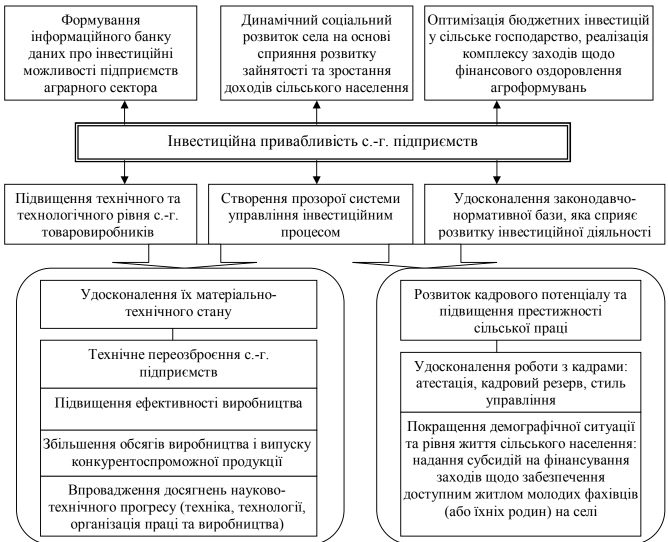
Рис. 3. Напрями підвищення інвестиційної привабливості с.-г. підприємств

У країнах з розвинутою ринковою економікою проблеми, які негативно впливають на інвестиційну привабливість, вирішуються комплексно, що підвищує ефективність залучення капіталовкладень у сільськогосподарське виробництво. Тому автором визначено напрями підвищення інвестиційної привабливості для забезпечення стійкого економічного розвитку та поліпшення виробничої діяльності аграрних підприємств (рис. 3). Іншим прикладом успішної співпраці європейського досвіду та капіталу і херсонських природних та людських ресурсів є діяльність спільного українсько-німецького підприємства «Флемінг+Вендельн Україна». Підприємство розпочинало свою діяльність з експорту зернових. Згодом керівництво підприємства змінило стратегію і крім виключно торговельних операцій фірма стала займатися вирощуванням та переробкою зернових. Значний внесок у підвищення соціально-економічних показників області зробили ТОВ «Механічний завод», ТОВ «Ведичне екологічно-чисте сільське господарство Махаріші», ТОВ «Агроінвест», ТОВ «Херсонес».