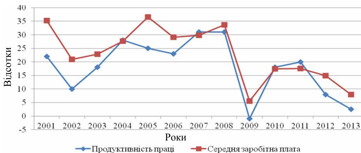
Рис. 3. Темпи зміни продуктивності праці та середньої заробітної плати в Україні за 2001–2013 рр.

і погодинною оплатою праці також спостерігається розрив. У 2012 р. почасова оплата праці лише трохи (на 0,4%) перевищувала рівень 2000 р., при тому що продуктивність праці підвищилася за той же період на 12,8%. [7]. Таким чином, спираючись на дані про оплату праці в 36 країнах було розраховано, що з 1999 р. у розвинутих країнах зростання продуктивності праці в середньому більш ніж удвічі перевищило зростання середньої заробітної плати. Це, з одного боку, говорить про значні резерви економічного росту та можливості ще підвищувати рівень заробітної плати, а з іншого, ще раз підтверджує скорочення долі праці у системі доходів. Треба відмітити, що на Україні спостерігається протилежна тенденція: середня заробітна плата зростає швидше ніж продуктивність праці. Тільки у період фінансової кризи 2008–2009 років цей процес сповільнився, але вже за даними 2013 року продуктивність праці зросла на 2,5%, а заробітна плата – на 8,2% (рис. 3). Такий розрив показує існування прихованих економічних проблем у країні і в подальшому може призвести до нової кризи у вигляді девальвації національної валюти.