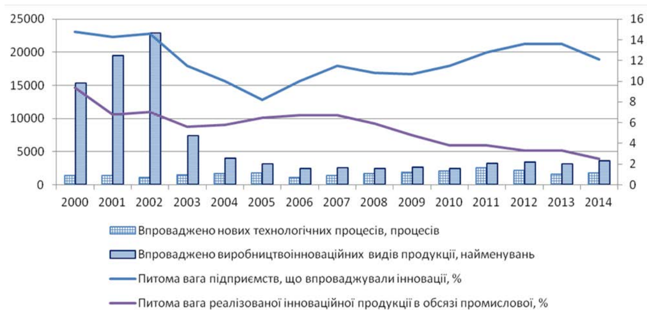
Рис. 1. Динаміка інноваційної активності підприємств України, 2000–2014 рр. (розроблено автором за даними [2])

Виклад основного матеріалу дослідження. Проведений аналіз статистичних даних виробничих підприємств України свідчить про стрімке скорочення інноваційної активності, починаючи з 2003–2004 років (рис. 1), незважаючи на економічне зростання в країні. Збільшення питомої ваги підприємств, що впроваджували інновації, у загальній кількості вітчизняних підприємств має стрибкоподібний характер, проте обсяг впровадження інноваційних технологій та продукції скорочується. Зазначена тенденція дозволяє дійти висновку, що новостворені господарюючі суб'єкти не приділяють достатньої уваги інноваційному розвитку, формуванню інноваційного потенціалу задля довготривалого існування на ринку.