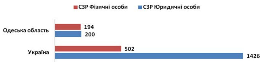
Рис. 1. Кількість СЗР України та Одеської області в 2014 році, одиниць (розроблено на підставі [2, с.8])