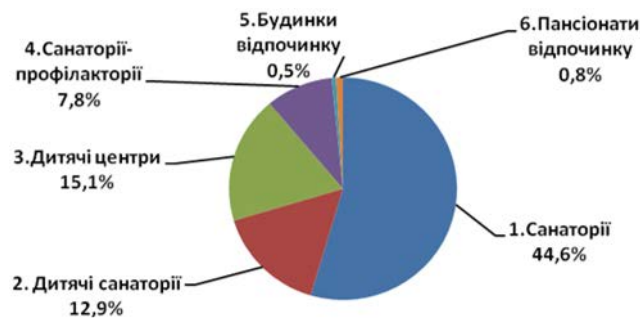
Рис. 3. Структура доходів спеціалізованих засобів розміщування Одеської області у 2014 році, % (розроблено на підставі [2, с.8])

Найбільша питома вага доходів у 2012–2014 роках припадала на санаторії (42,9–44,6%), бази та інші заклади відпочинку (27,8–18,3%). Значно збільшилася протягом 2012–2014 років питома вага доходів дитячих санаторіїв та дитячих центрів. У структурі доходів в 2014 році превалюють доходи санаторіїв – 44,6%, баз та інших закладів відпочинку – 18,3%, дитячих центрів – 15,1%, дитячих санаторіїв – 12,9% (рис. 3).