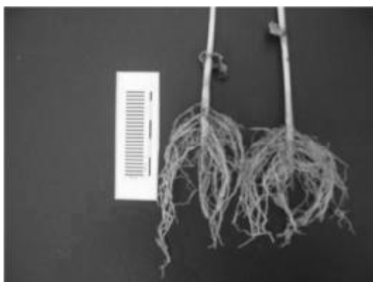
Коренева система рослин у варіантах із одиночною вегетацією