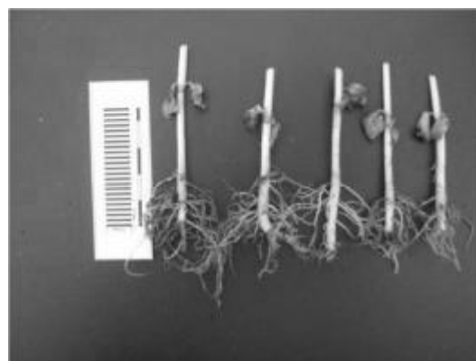
Коренева система рослин у варіантах із груповою (5 рослин/посудину) вегетацією