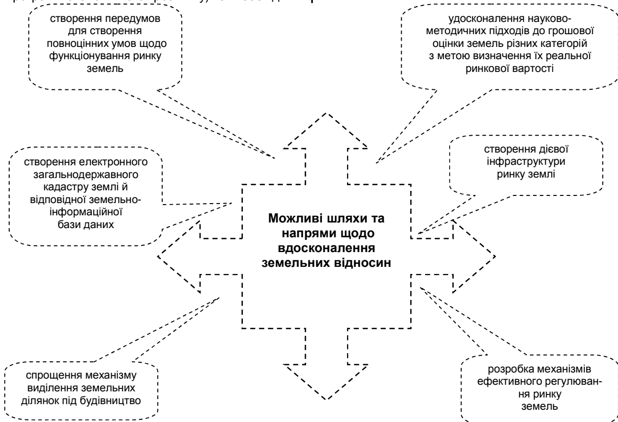
Рис.4. Можливі шляхи та напрями щодо вдосконалення земельних відносин

проведення цілої низки заходів та мікрореформ (рис. 4).