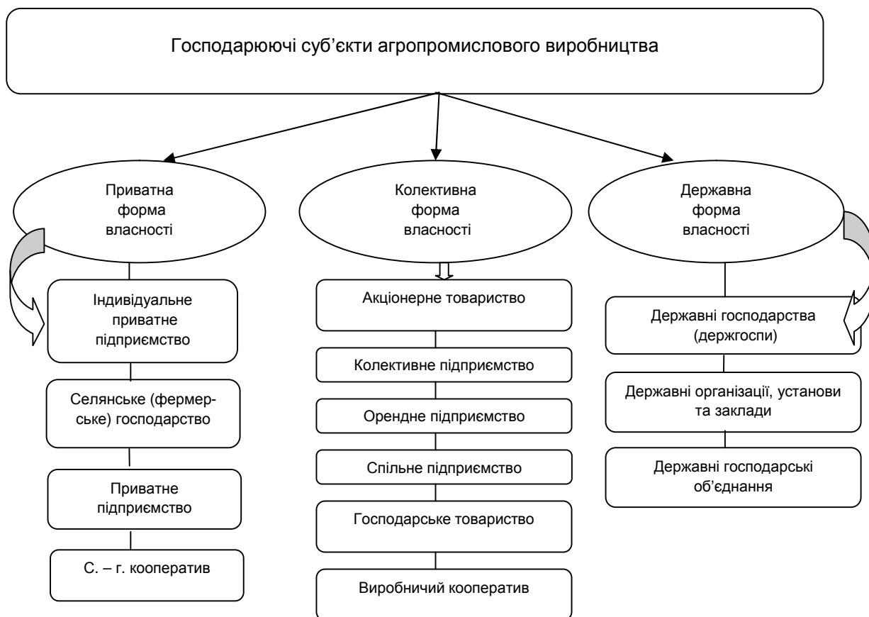
Рис. 1. Класифікація організаційно-правових форм підприємств

Як правило, власники одночасно є і керівниками. Це одна з найбільш поширених простих і динамічних форм бізнесу.