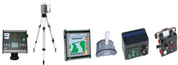
Рис.2. Прилади точного керування технікою в сільському господарстві

та приймати швидкі та ефективні рішення. Засоби точного керування технікою можна представити у наступному вигляді (рис. 2).