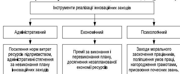
Рис.1. Інструменти реалізації інноваційних заходів

Також слід відмітити інструменти, за допомогою яких реалізуються інноваційні заходи (рис. 1).