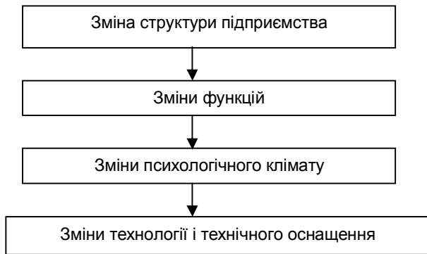
Рис. 2. Зміни підприємства у процесі його реструктуризації

Реалізація проекту реструктуризації має на увазі під собою перелік змін. (рис.2).