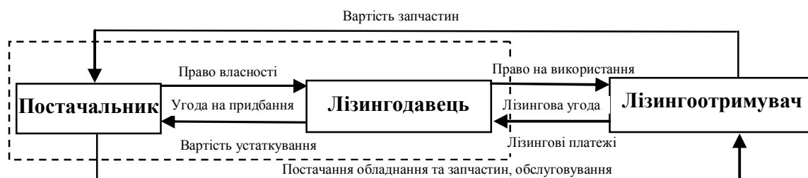
Рис. 2 Взаємовідносини учасників лізингової угоди

носини між якими схематично показано на рис. 2. Слід зазначити, що зазначена система взаємовідносин спрощується, якщо постачальник є також лізингодавцем, як це показано на рис. 2. пунктирною лінією.