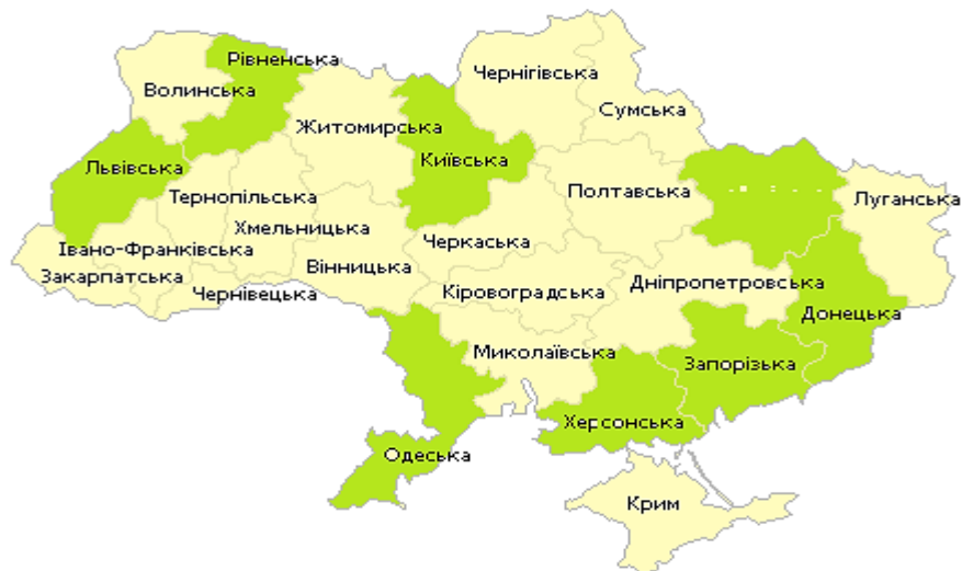
Рис.3. – Місцерозташування оптових ринків сільськогосподарської продукції