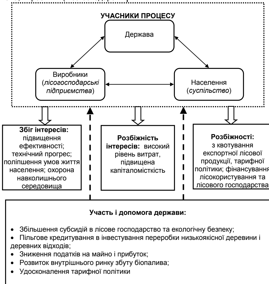
Рис. 1. Організаційно-економічний механізм балансування інтересів суб'єктів землекористування в лісовому господарстві

дарстві зображено на рис. 1. Учасниками процесу виступають держава, виробники (лісогосподарські підприємства) та населення (суспільство).