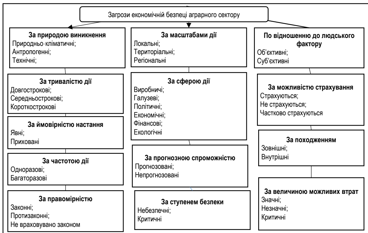
Рис. 2. Загрози економічній безпеці аграрного сектору економіки

Пропонується виділяти класифікаційні ознаки загроз економічній безпеці аграрного сектору із врахуванням галузевих особливостей, зокрема: походження загроз, сфера життєдіяльності виробника та масштаб дії, природа їх виникнення, частота дії, тривалість впливу, ймовірність настання, правомірність, можливість їх прогнозування та страхування, величина втрат, об'єкт посягань, ступінь небезпеки виробника та рівень завершеності загроз. Більшість загроз взаємопов'язані та, з одного боку, обумовлюють одна одну, а, з іншого - є автономними відносно одна одної. За сферою дії загрози економічній безпеці можна поділити на виробничі (нестача ресурсів, техніки на сільськогосподарському підприємстві, знос матеріально-технічної бази, порушення технологічного процесу), галузеві (низький рівень інвестиційної при-