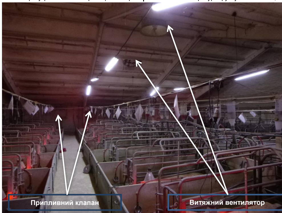
Рис.1. Секція приміщення де утримувались свиноматки контрольної групи

Свиноматок дослідної групи розмістили у приміщенні з геотермальною вентиляцією негативного тиску (рис. 2), принцип дії якої полягав у тому, що повітря за рахунок розрідження, яке створюється витяжними даховими вентиляторами, потрапляє в приміщення через підземні тунелі заповнені камінням різної величини. Далі повітря через перфоровані повітропроводи розташовані над станками розподіляється по приміщенню. У літній період повітря охолоджується, а в зимовий – прогрівається за рахунок досить стабільної температури ґрунту на глибині 0,8-1,2 м.