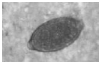
Рис. 1. Яйце трихурисів (×620).

(рис. 1); другі, у вигляді продовгуватого еліпса з майже паралельними боковими сторонами, одна з яких більш опукла, коричневі, середні, але менші за попередні (0,065-0,072×0,029-0,032 мм), на полюсах плоскі пробочки, оболонка багатшарова з дрібнокомірчастою поверхнею, в середині дрібнозернистий вміст – яйця капілярій (рис. 2). Яйця стронгілідного типу (сірі, середнього розміру (0,065-0,079×0,032-0,049 мм), овальні, широкі, бокові стінки помірно сплюснені, з тонкою гладкою оболонкою і крупними бластомерами всередині) – унцинарій.