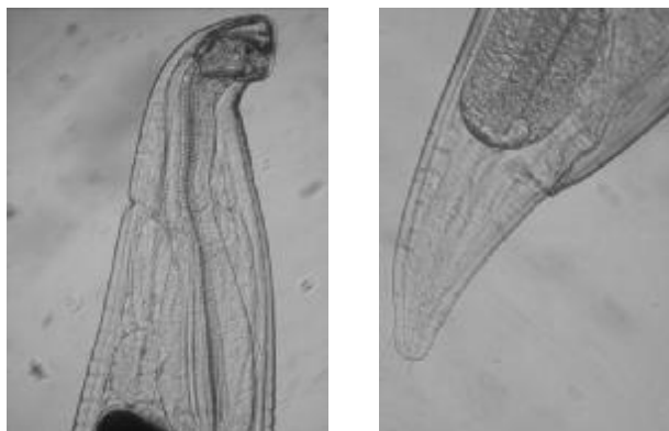
Рис. 3. Головний та хвостовий кінці самки унцинарії (×620).

Отже, трихуроз ( Trichurosis ) виявлено у 3-ох тварин (EI=75,0 %), капіляріоз ( Capillariosis ) також у 3-ох (EI=75,0 %), унцинаріоз ( Uncinariosis ) у 2-ох (EI=50,0 %), а теніоз ( Taeniosis ) у однієї (EI=25,0 %). Склад кишкових гельмінтоценозів сірих вовків налічував 2-3 види гельмінтів у однієї тварини.