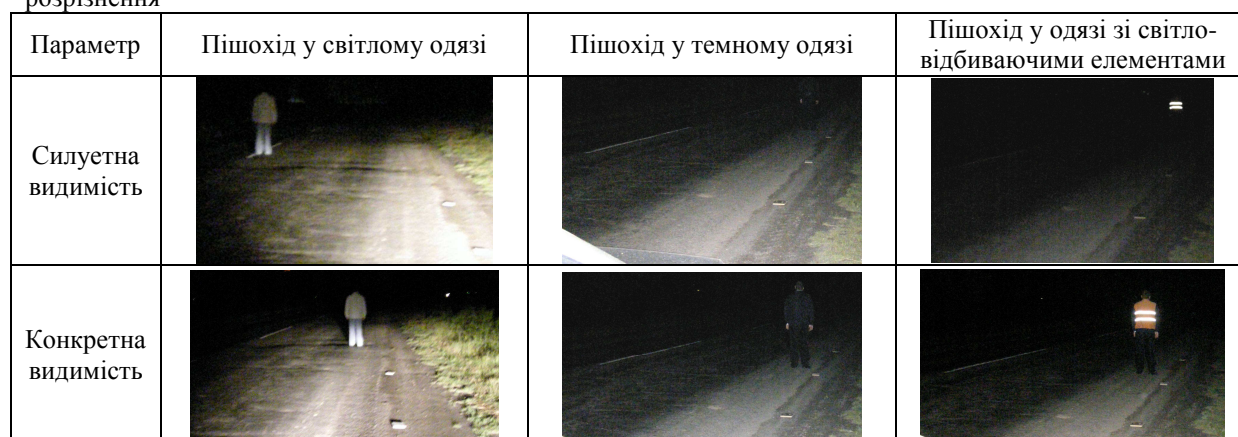
Таблиця 2 – Усереднені експериментальні значення дальності видимості в залежності від автомобілів, які використовувались в експериментах