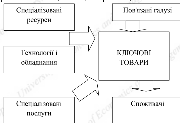
Рис 1. Структура кластера [10]

Виходячи з даних досліджень, відображуючи динаміку відносних переваг, кластери формуються, розширюються, поглиблюються, але можуть також згодом звужуватися і розпадатися. Подібна динамічність і гнучкість кластерів є ще однією перевагою в порівнянні з іншими формами організації економічної системи. Згодом ефективно діючі кластери стають причиною великих капіталовкладень і пильної уваги уряду, тобто кластер стає чимсь більшим, ніж проста сума окремих його частин. Центром кластера найчастіше буває кілька потужних підприємств, при цьому між ними зберігаються конкурентні відносини. Концентрація суперників, їх покупців і постачальників сприяє росту ефективної спеціалізації виробництва.