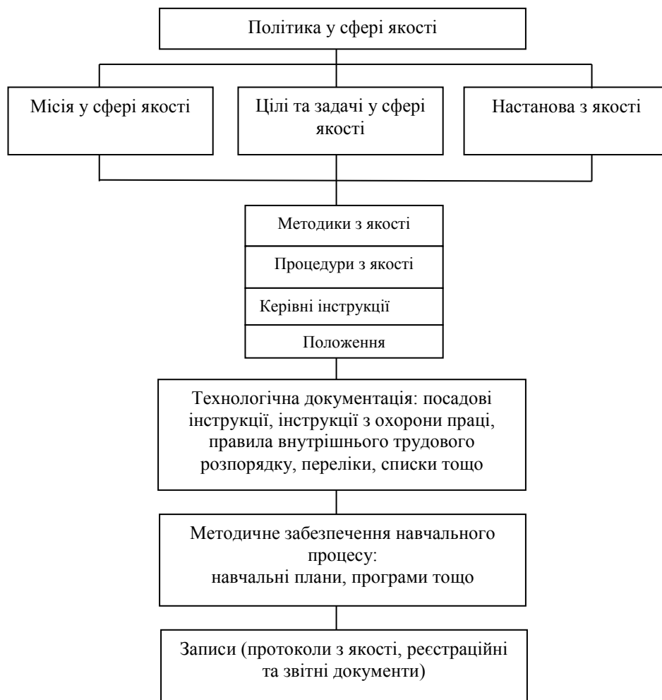
Рис. 3. Загальна структура документів системи управління якістю у ВНЗ (власна розробка)

Ефективна система управління якістю передбачає побудову системи управління документами, що включає базу для проведення аудитів, оцінювання результативності і придатності СУЯ [1]. Документація ВНЗ і управління нею набуває значущості і актуальності, оскільки є одним з найважливіших елементів побудови ефективної СУЯ. Загальна структура документації системи управління якістю у ВНЗ може бути представлена схемою, зображеною на рис. 3.