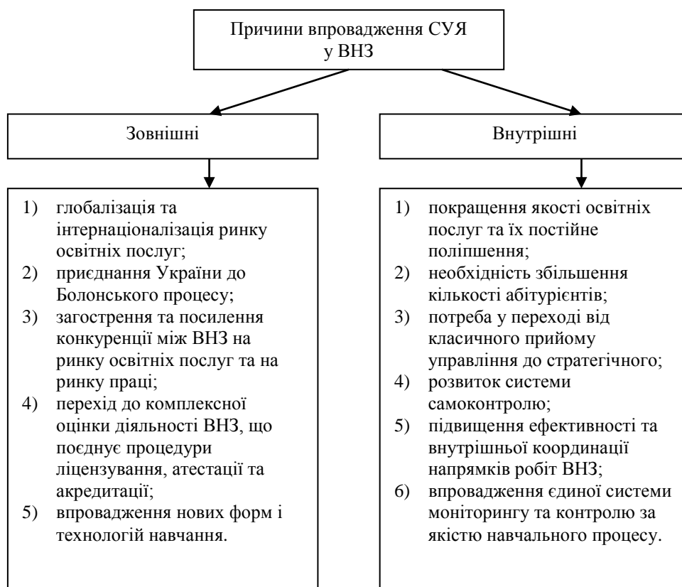
Рис. 1. Причини впровадження СУЯ у ВНЗ (власна розробка)

Саме конкурентоспроможність є основоположним орієнтиром розвитку ВНЗ і виступає базовим фактором, що орієнтує керівництво закладу вищої освіти на інноваційний пошук та постійний розвиток, невід'ємним елементом якого є впровадження СУЯ. Ще донедавна вважалося, що про конкуренцію у сфері освіти говорити недопустимо, проте останнім часом ситуація на ринку праці говорить про те, що це питання давно назріло і вимагає детального розгляду. Конкуренція загострюється, і проблема управління конкурентоспроможністю ВНЗ стає усе більш актуальною у зв'язку з прогнозованим демографічним спадом, наслідком чого буде зниження попиту на освітні послуги.