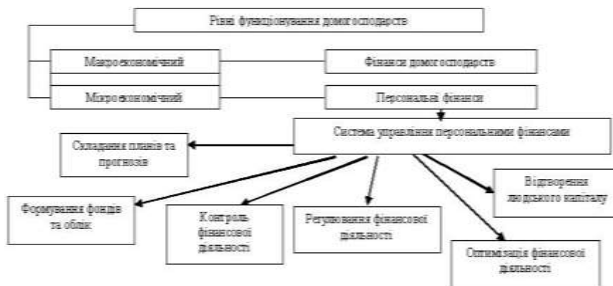
Рис. 1. Функціональна градація термінів, що використовуються у сфері фінансів домогосподарств

Запропонована функціональна градація термінології стосовно сфери фінансів домогосподарств та управління ними має такий вигляд (рис. 1).