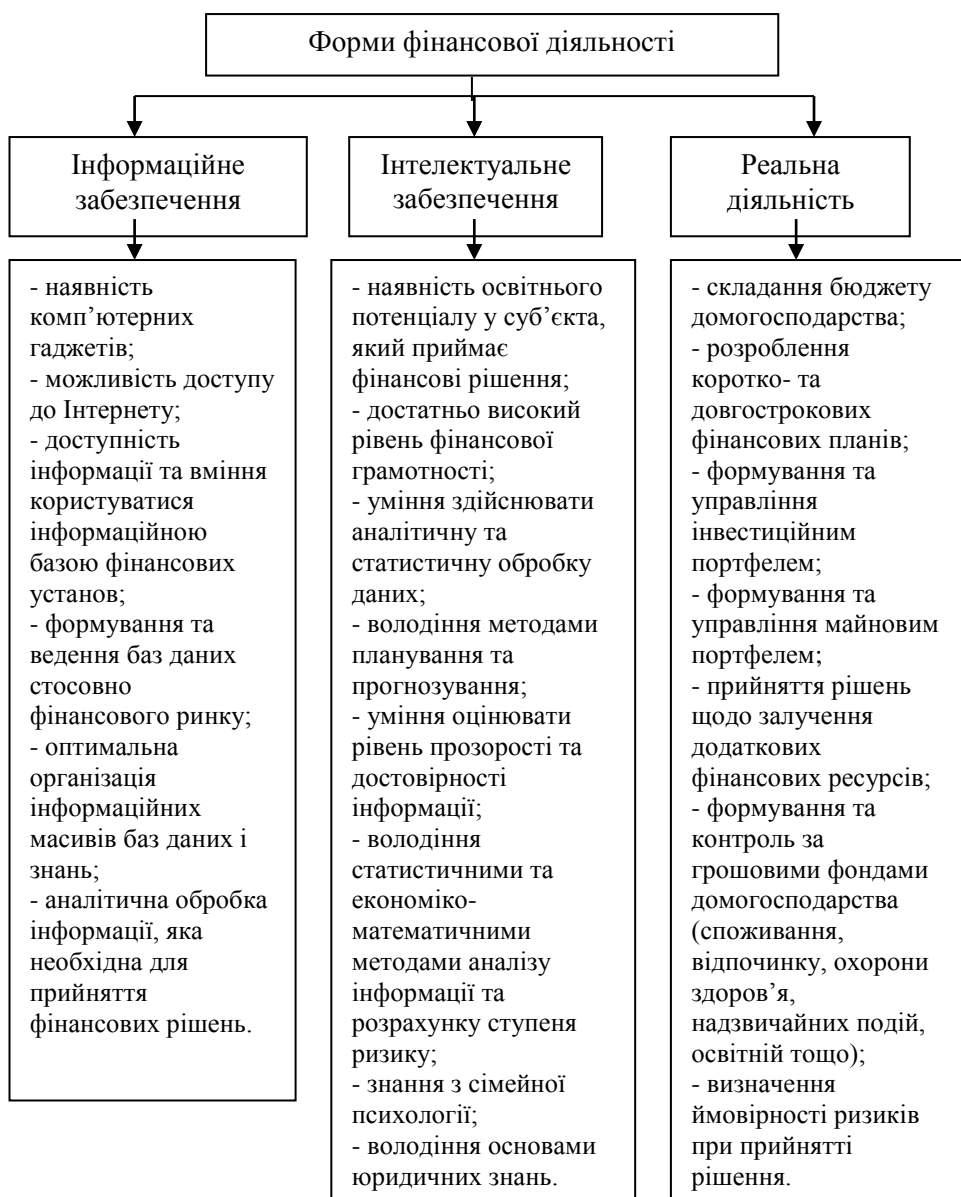
Рис. 2. Форми здійснення фінансової діяльності домогосподарства

Основним принципом позитивного функціонування домогосподарства є розвиток та збільшення людського капіталу, що здійснюється за власні або залучені кошти, – освіта, охорона здоров'я, забезпечення житлом, підвищення якості життя, свого соціального статусу.