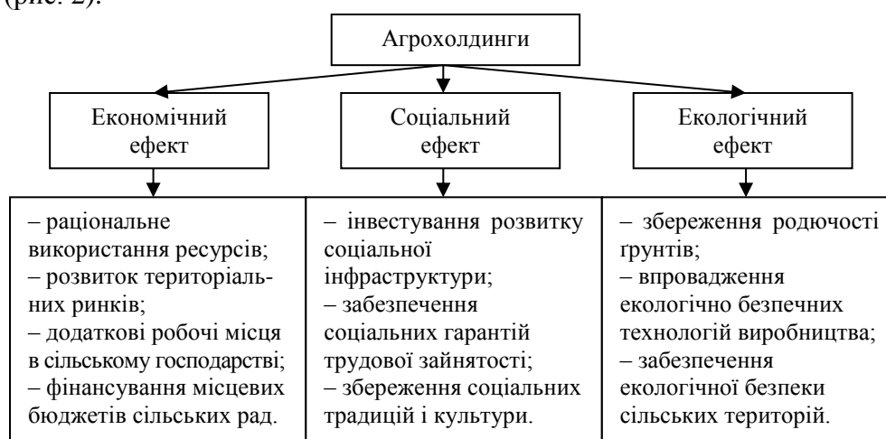
Рис. 2. Напрямки ефективної діяльності агрохолдингів

Таким чином, діяльність агрохолдингів, на нашу думку, повинна бути зорієнтована на досягнення економічних, соціальних і екологічних показників розвитку сільського господарства країни (рис. 2).