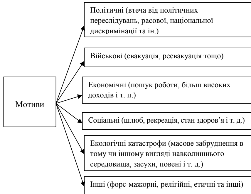
Рис. 1. Критерії, що дозволяють виділити міграцію з інших переміщень громадян через кордон