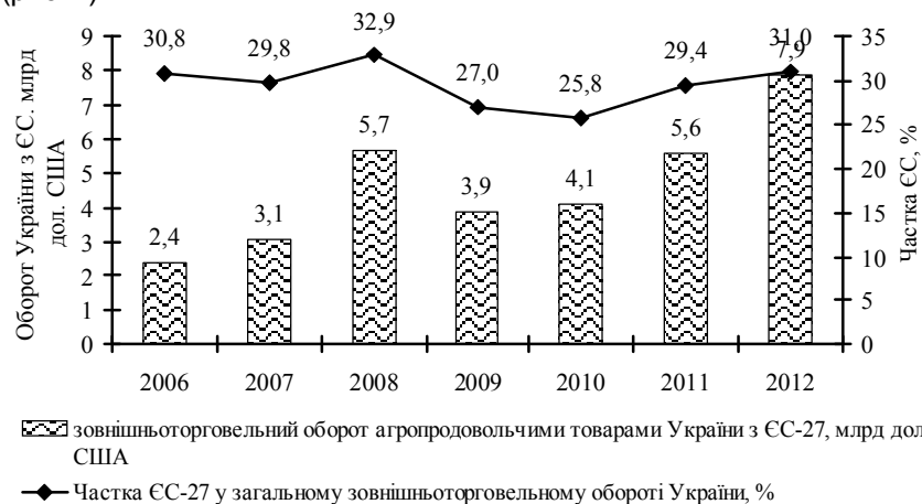
Рис. 2. Динаміка товарообороту агропродовольчої продукції України з країнами ЄС-27, 2006–2012 рр.

Двосторонній зовнішньоторговельний оборот агропродовольчими товарами між ЄС та Україною суттєво зріс, починаючи з 2008 р., що зумовлено приєднанням України до СОТ (рис. 2).