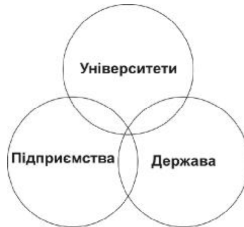
Рис. 1. Троїста спіраль кластеризації економічного розвитку

Виклад основного матеріалу. У 1980-х роках у США, а дещо пізніше – в Європі розпочалося формування кластерного підходу у вирішенні завдань розвитку економіки. За цей час він виріс у форму організації виробництва і науково-технічної діяльності, яка суттєво визначає суспільний прогрес світової економіки. Процес кластеризації змінився від концентрації підприємств на певній території для наближення до ресурсної бази і суміжних виробництв з метою економії на транспортних витратах до об'єднань виробничих фірм і установ, що здійснюють наукові розробки. За оцінками експертів, нині у світі кластеризацією охоплено близько 50% національних економік. У США в рамках кластерів працюють більше, як половина підприємств, а питома вага ВВП, що виробляється ними, перевищила 60%. В Європейському Союзі нараховується більше 2 тис. кластерів, у діяльності яких задіяно 38% робочої сили [4; 2, с. 38–51].