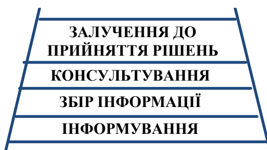
Рис. 1. Драбина громадської участі [3]

Сам діалог влади з громадянами є поступовим, а європейські науковці представляють його за допомогою “драбини громадської участі”, починаючи із зазначення мінімального рівня участі громадян у процесі прийняття публічних рішень і закінчуючи максимально високою участю в цих процесах (рис. 1).