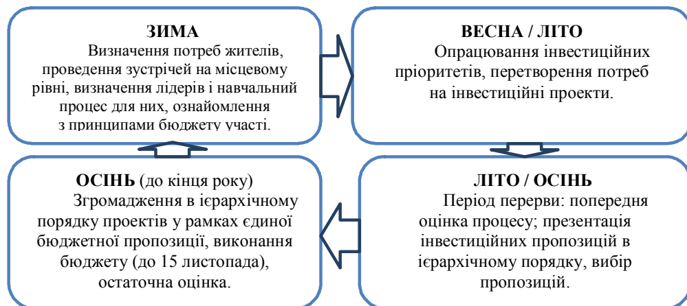
Рис. 4. Зразок циклу бюджету участі [6]

Висновки та перспективи подальших розвідок. Підбиваючи підсумок, слід зазначити, що для ефективного впровадження бюджету участі в Україні необхідне співіснування трьох основних факторів. По-перше, введення цього інструменту вимагає сильної підтримки з боку державних органів влади, яка не блокуватиме громадські ініціативи та процедури і буде готова відмовитися від реалізації частини своїх повноважень на користь громадян. По-друге, ці механізми можуть ефективно функціонувати тільки в громадянському суспільстві, яке хотітиме і матиме реальну можливість брати в них участь. Як видно з практичного досвіду інших країн, безпосередні форми участі громадян у здійсненні влади є найбільш успішними на місцевому рівні, де активно діють неурядові організації та інші громадські рухи. Останнім важливим елементом є наявні фінансові ресурси для реалізації запланованих проектів, відібраних громадянами. Разом з тим, право участі громадян у прийнятті бюджетних рішень може бути реалізоване повною мірою, коли в загальному бюджеті адміністративно-територіальної одиниці буде виділено певну суму бюджетних коштів для виняткового розпорядження громадян.