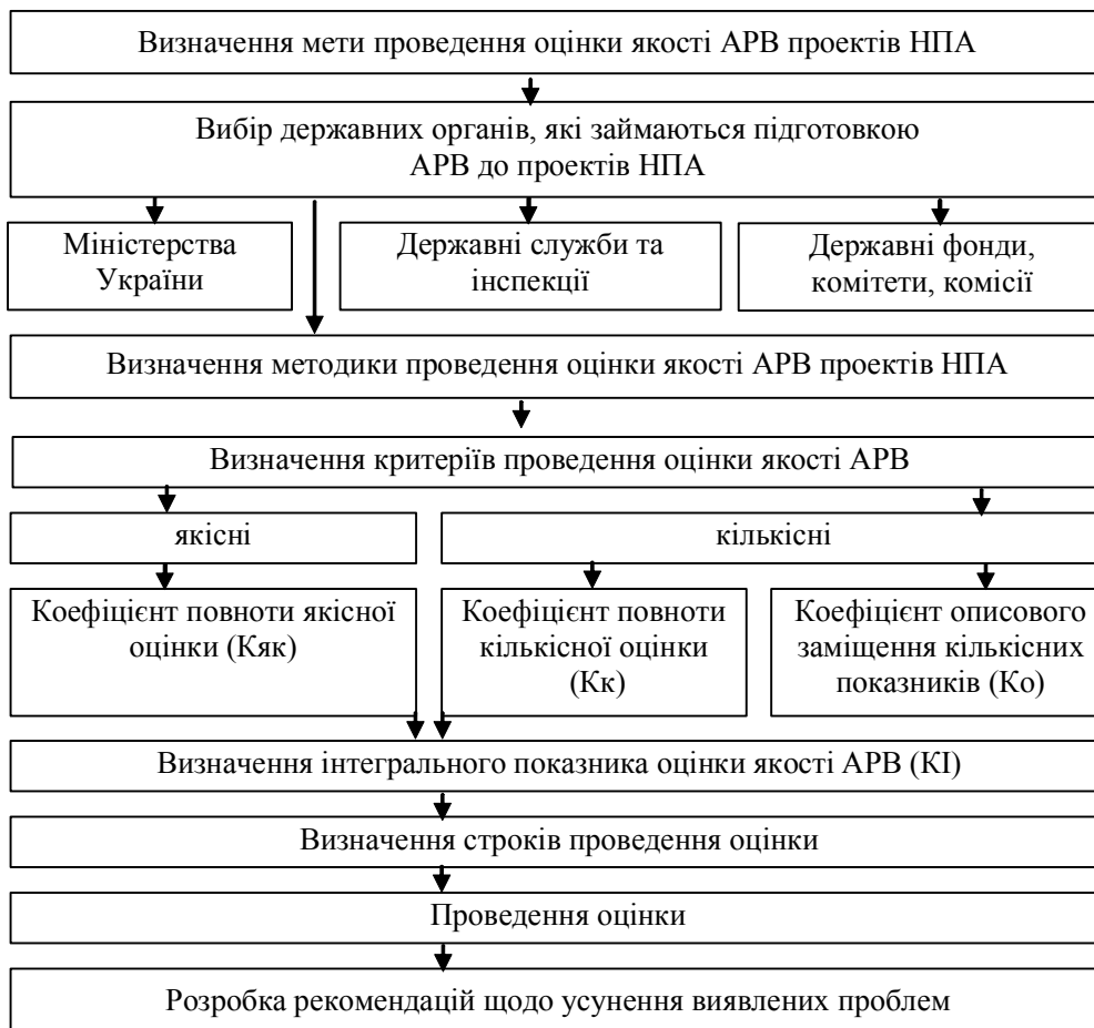
Рис. 1. Методичний підхід до оцінки ефективності здійснення регуляторними органами аналізу регуляторного впливу проектів нормативно-правових актів

K_k = 0 – у випадках, коли жоден з 4-х обов'язкових показників не розрахований і не має якісної оцінки;