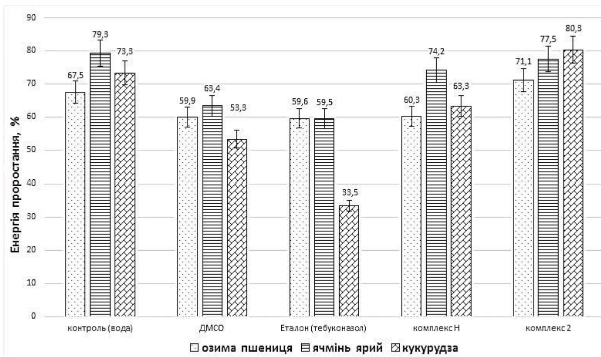
Рис. 2. Енергія проростання насіння тест-культур, обробленого досліджуваними препаратами, — p < 0.05 .

На рисунку 2 представлені результати дослідження впливу усіх зазначених чинників на енергію проростання насіння тест-культур. З даних діаграми видно, що ДМСО, тебуконазол та комплекс Н достовірно знижують показники енергії проростання насіння усіх культур (гальмування появи проростків спостерігалось в межах 2,3–27,0 %). Тоді як комплекс 2 знижує енергію проростання насіння тільки ячменю ярого на 2 %. Тебуконазол виявив фітотоксичну дію на насінні кукурудзи, яка сягала 54,3 % від значення отриманого в контролі за обробки водою. Стимулюючий ефект у 9,5 % фіксували на кукурудзі за застосування комплексу 2. Цей препарат мав також невеликий стимулюючий ефект у 5,3 % на розвиток озимої пшениці в порівнянні з контролем (вода).