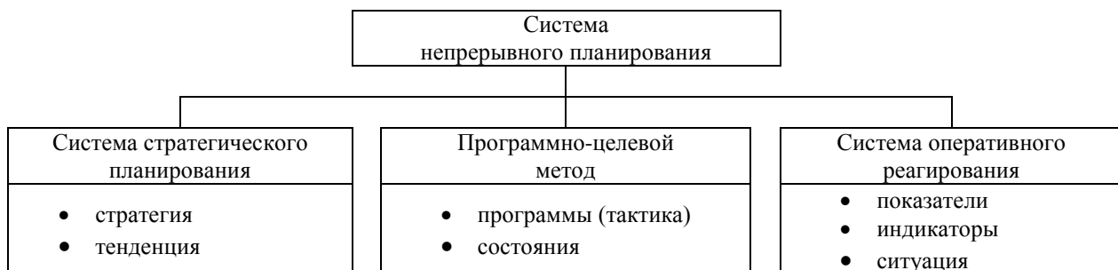
Рис. 1. Элементы системы непрерывного планирования.

Эффективная система управления предприятием, на наш взгляд, должна основываться на формировании системы непрерывного планирования, которая, в свою очередь, включает ряд элементов: систему стратегического планирования, программно-целевой подход, систему оперативного реагирования (рис. 1).