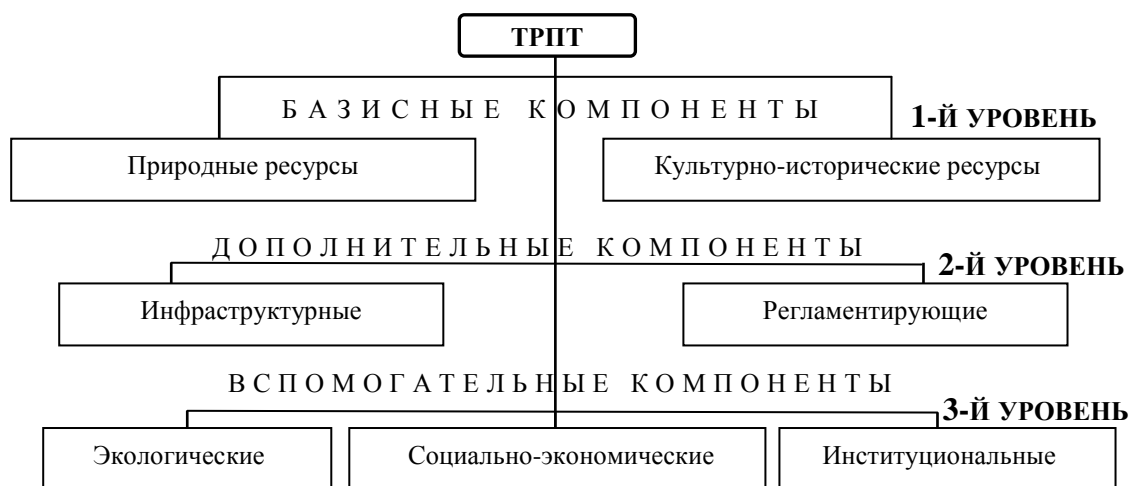
Рис. 1. Основные компоненты туристско-рекреационного потенциала территории.

На основе компаративного анализа трудов ранее приведенных специалистов [3–7; 11; 12] можно заключить, что природные ресурсы являются ведущим фактором, определяющим рекреационное использование территории, и вместе с культурно-историческими (антропогенными) рекреационными ресурсами становятся базисом, определяющим аттрактивность (привлекательность) территории и формы рекреационной деятельности той или иной дестинации. Тем не менее, для полноты определения потенциала и его активизации в перспективе, на наш взгляд, этого недостаточно. Его базовые составляющие необходимо содержательно дополнить такими компонентами, как инфраструктура территории, обеспечивающая возможность ее эксплуатации для нужд рекреантов, регламентирующие компоненты, социально-экономическая и экологическая составляющие, другими элементами институционального характера (рис. 1).