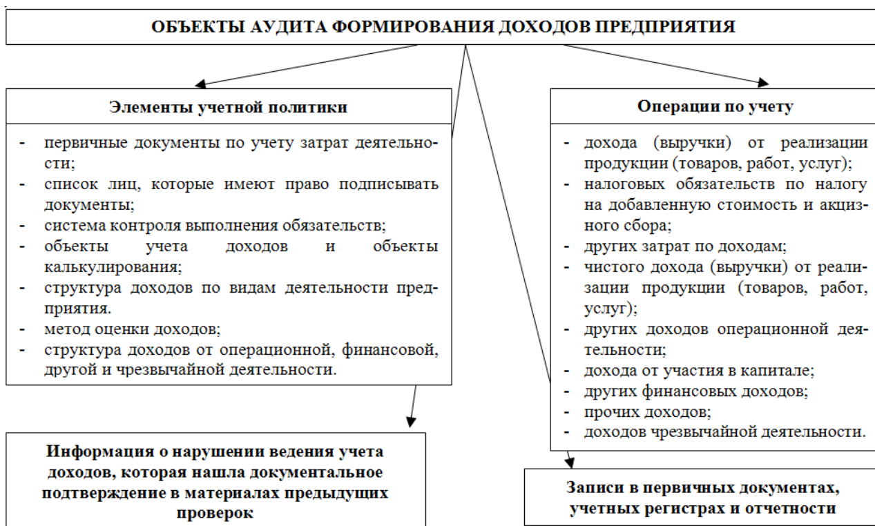
Рис. 2. Объект аудита формирования доходов предприятия.

Разработан рабочий документ, который составляется аудитором на начальном этапе. Аудит правильности формирования доходов, полученных в результате хозяйственной деятельности, направленный на подтверждение критериев достоверности и полноты. Нами идентифицированы объекты аудита доходов предприятия (рис. 2).