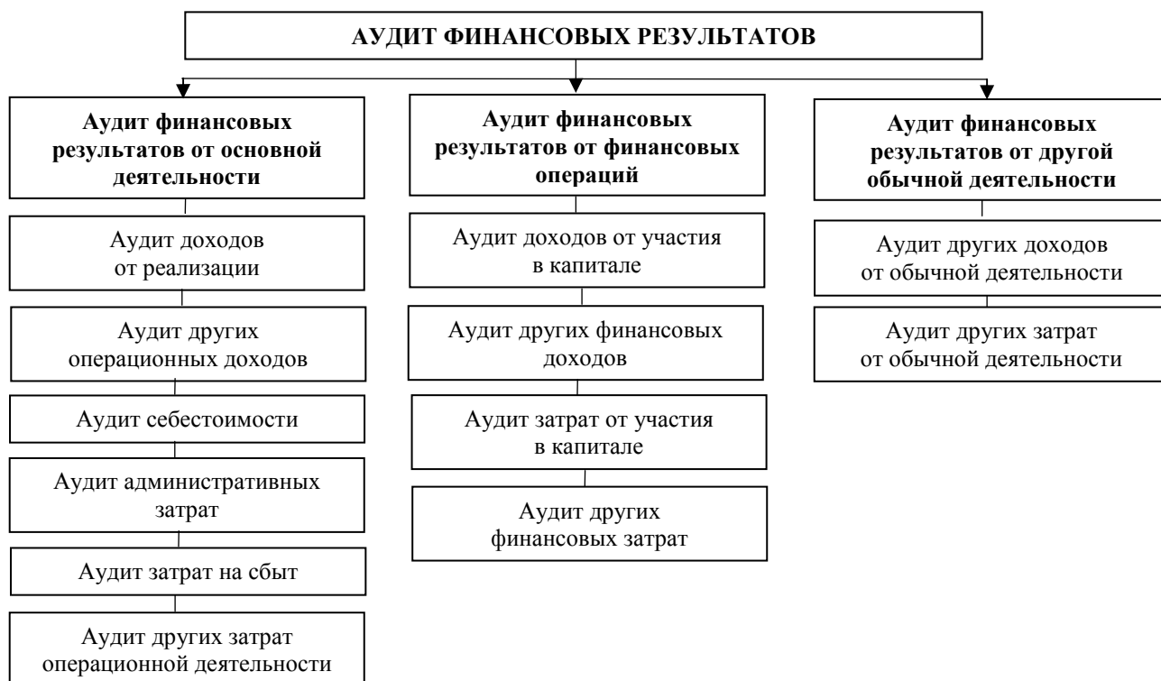
Рис. 1. Порядок проведения аудита финансовых результатов.

С целью проверки достоверности, отраженной в учете на счетах информации о доходах, расходах и финансовых результатах, аудитор должен изучить: элементы учетной политики субъекта хозяйствования по вопросам доходов и финансовых результатов; достоверность операций по учету доходов и финансовых результатов; записи в первичных документах, регистрах учета и отчетности за доходами и финансовыми результатами; информацию о доходах и финансовых результатах, которая нашла отражение в предыдущих проверках. Аудиторскую проверку формирования финансовых результатов целесообразно осуществлять в соответствии к порядку, который представлен схематично на рис. 1.