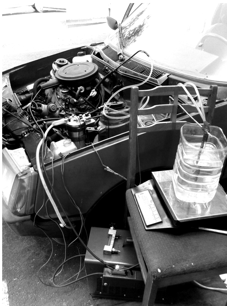
Рис. 1. Експериментальна установка

Для оцінки технічного стану автомобіля та визначення параметрів роботи двигуна була створена експериментальна установка (рис. 1). Вона складалася з таких частин: автомобіль ЗАЗ-1102 «Таврія», електролізер Ліга-02 (220 В), електролізер SuperKit 10 (12 В) (рис. 2) та вимірювальні прилади – ротаметр типу Р-0,063, інфрачервоний газоаналізатор «Інфракар 08.01», електронні терези МЕРА ВМ 2/3, цифровий мультиметр Digital Instrument DT9205A, стробоскоп DA-5100.