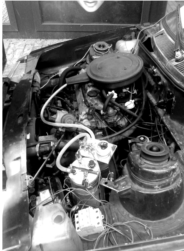
Рис. 2. Електролізер SuperKit 10, встановлений на борту автомобіля

максимального значення. Визначення частоти обертання колінчастого валу та кута випередження впорскування здійснено за допомогою стробоскопа DA-5100.