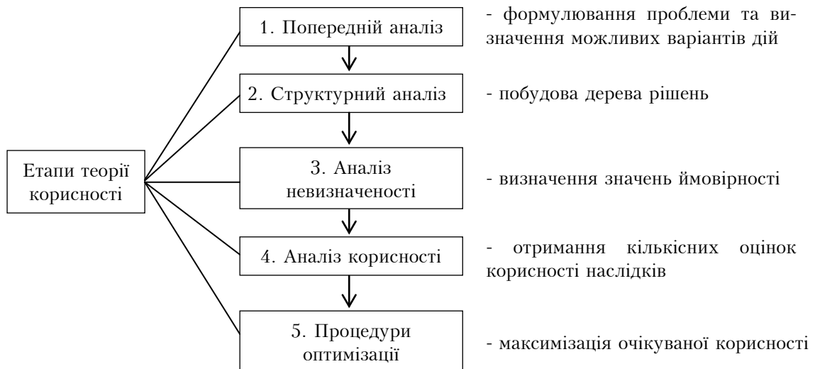
Рис. 1. Етапи теорії корисності

Викладення основного матеріалу. Багатокритеріальність завдань управління дорожнім рухом на залізничному переїзді, а також їх програмно-математичне забезпечення, що не повною мірою враховує специфіку деяких завдань, підвищують ймовірність помилкових дій з боку людини і, як наслідок, ймовірність збоїв в роботі переїзду. У зв'язку з цим, формалізація завдань управління дорожнім рухом на залізничному переїзді з застосуванням теорії корисності актуальна, оскільки при автоматизації подібних розрахунків ЕОМ за лічені хвилини може охарактеризувати шанси на успіх і можливі наслідки дій ЛПР [10]. Ці дані дозволять виключити ймовірність помилкових дій, пов'язаних з великими втратами, що, у свою чергу, сприяє підвищенню надійності систем управління дорожнім рухом та безпеки руху транспорту. Застосування теорії корисності може бути реалізовано п'ятьма етапами [2, 9] (рис. 1).