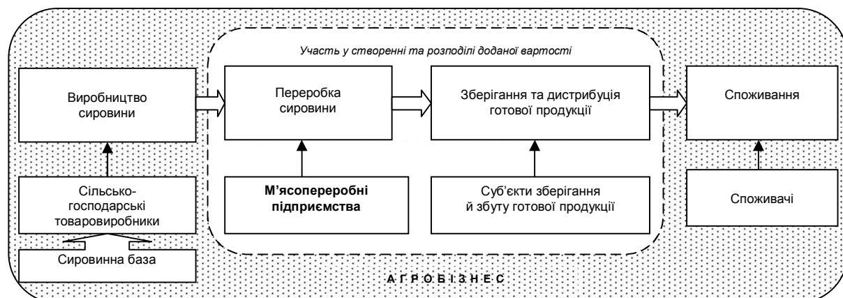
Рис. 1. Місце м'ясопереробних підприємств у створенні та розподілі доданої вартості в галузі м'ясопереробки

По-друге, розбалансованість економічних взаємовідносин між виробниками сировини та переробними підприємствами проявляється як у обсягах забезпечення вітчизняною сировиною, так й у формуванні взаємовигідних цін. Всі ланки технологічного ланцюга, починаючи з виробництва сировини й завершуючи реалізацією готової продукції, функціонують у режимі організаційного відокремлення, кожен суб'єкт господарювання керується виключно власними економічними інтересом. При цьому, формування єдиної економічної політики у м'ясопереробній галузі можливе лише за умови побудови однакових стратегічних цілей партнерів з агробізнесу та реалізації спільних економічних пріоритетів.