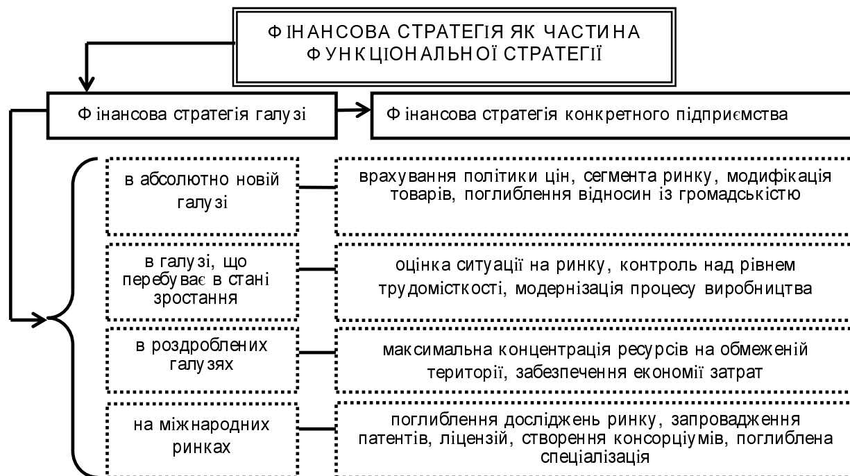
Рис. 1. Фінансова стратегія залежно від галузевої орієнтації (згруповано автором)

Потрібно зауважити, що більш конкретні стратегії в галузі детально аналізує В.Г. Герасимчук [12, с. 175–182]. Так автор диференціює стратегію лідера в галузі на: стратегію наступу, стратегію фірми-претендента на лідерство, оборонну стратегію. Кожній із зазначених стратегій характерний набір правил і дій. Наприклад, реалізуючи стратегію наступу, підприємство має оцінити рівень витрат і намагатися максимально їх зменшити, постійно збільшувати попит на продукцію, запроваджувати інновації. Проте, поряд з цим, виникає запитання: чому окремо не систематизовано і не виділено для розгляду фінансову стратегію наступу, оборони, претендента на лідерство? Адже саме ця стратегія як жодна інша впливає на формування, мобілізацію ресурсів для забезпечення дієвості зниження витрат, впливу на еластичність попиту, можливості інвестування. Тому, вважаємо за необхідне констатувати той факт, що залежно від дій підприємства в галузі – вихід на ринок, лідерство, зміцнення, оборона, аналогічним чином можна формулювати назви для фінансових стратегій як для запланованого спектра дій. Таким чином, можна зазначити, що в цілому на рівні будь-якої галузі можна виділити: