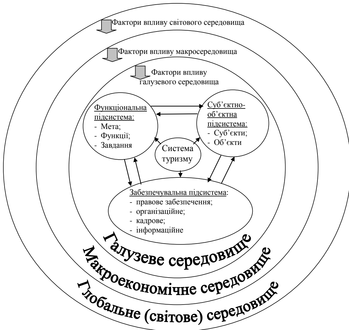
Рис. 2. Концептуальна модель системи туризму

Виходячи з наданої характеристики складових туризму, концептуальна модель туризму на підставі виокремлення зазначених вище підсистем наведена на рисунку 2.