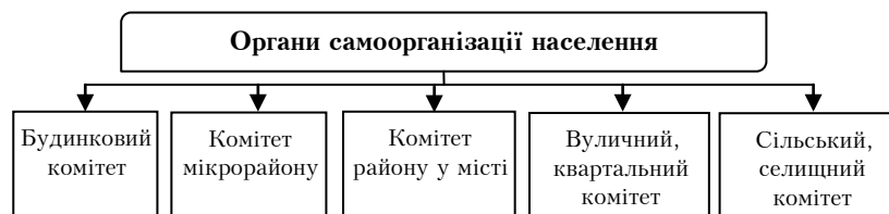
Рис. 2. Адміністративно-матеріальні одиниці органів самоорганізації населення

Органи самоорганізації населення створюються за ініціативою самих жителів та з дозволу відповідної сільської, селищної, міської, районної у місті (у разі її створення) ради на окремих частинах відповідних адміністративно-територіальних одиниць, а саме: сільського, селищного комітету – в межах території села, селища, якщо його межі не збігаються з межами діяльності сільської, селищної ради; вуличного, квартального – в межах території кварталу, кількох або однієї частини вулиць з прилеглими провулками у місцях індивідуальної забудови; комітету мікрорайону – в межах території окремого мікрорайону, житлово-експлуатаційної організації в містах; будинкового – в межах будинку (кількох будинків) в державному і громадському житловому фонді та фонді житлово-будівельних кооперативів; комітету району у місті – в межах одного або кількох районів у місті, якщо його межі не збігаються з межами діяльності районної у місті ради (ст. 14) [5].