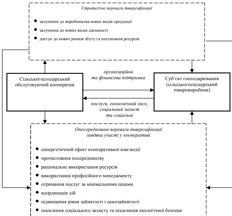
Рис. 1. Вплив сільськогосподарської обслуговуючої кооперації на розвиток диверсифікації діяльності малих та середніх аграрних підприємств