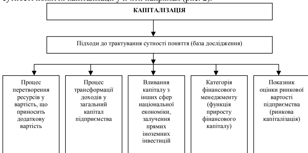
Рис. 2. Визначення сутності капіталізації

Дослідження різних теоретичних підходів дає підстави для узагальнення сутності поняття капіталізації у п'яти напрямках (рис. 2).