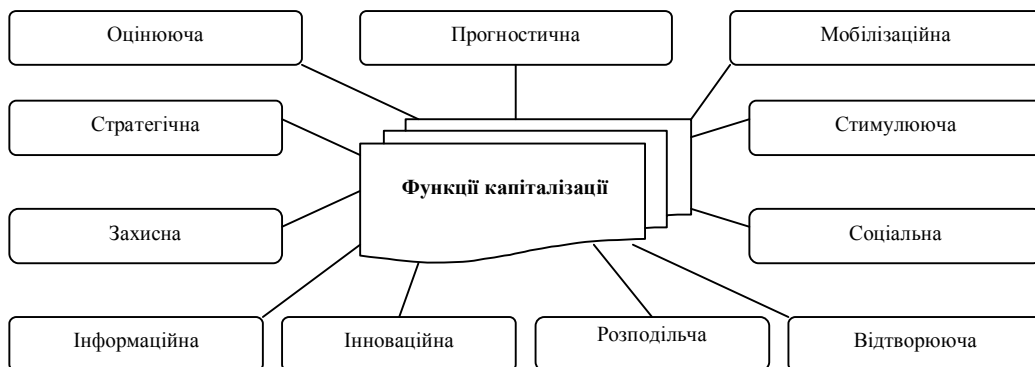
Рис. 3. Функції капіталізації

З огляду на проведені дослідження, варто звернути увагу на можливість виділення функцій, зокрема, відтворюючої, соціальної, інноваційної та захисної (рис. 3).