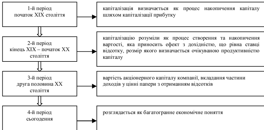
Рис. 1. Основні періоди розвитку дефініції поняття «капіталізація»

Епоха кейнсіанства зробила новий крок у вивченні капіталізації як економічного поняття. Згідно з її теорією, капіталізація базується на накопиченні капіталу за допомогою грошового обороту. В результаті завершення виробничого циклу частина створеного грошового доходу споживається, а інша частина – спрямовується на підтримання та розвиток активів і, таким чином, накопичується.