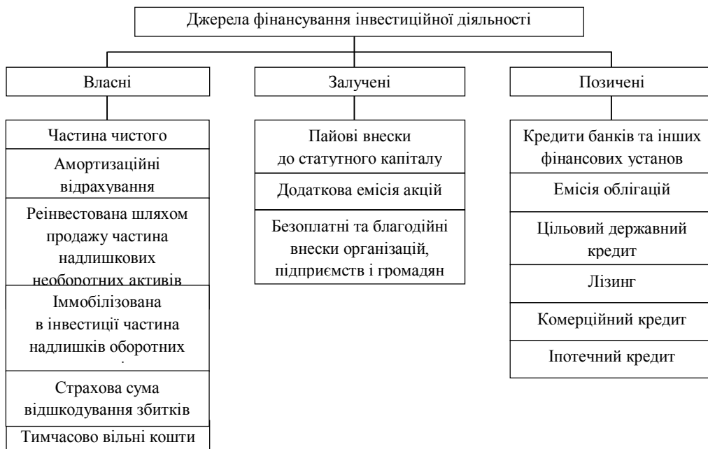
Рис. 1. Джерела фінансування інвестиційної діяльності