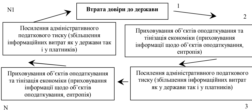
Рис. 2. Інформаційно-довірчий цикл Податкової системи України